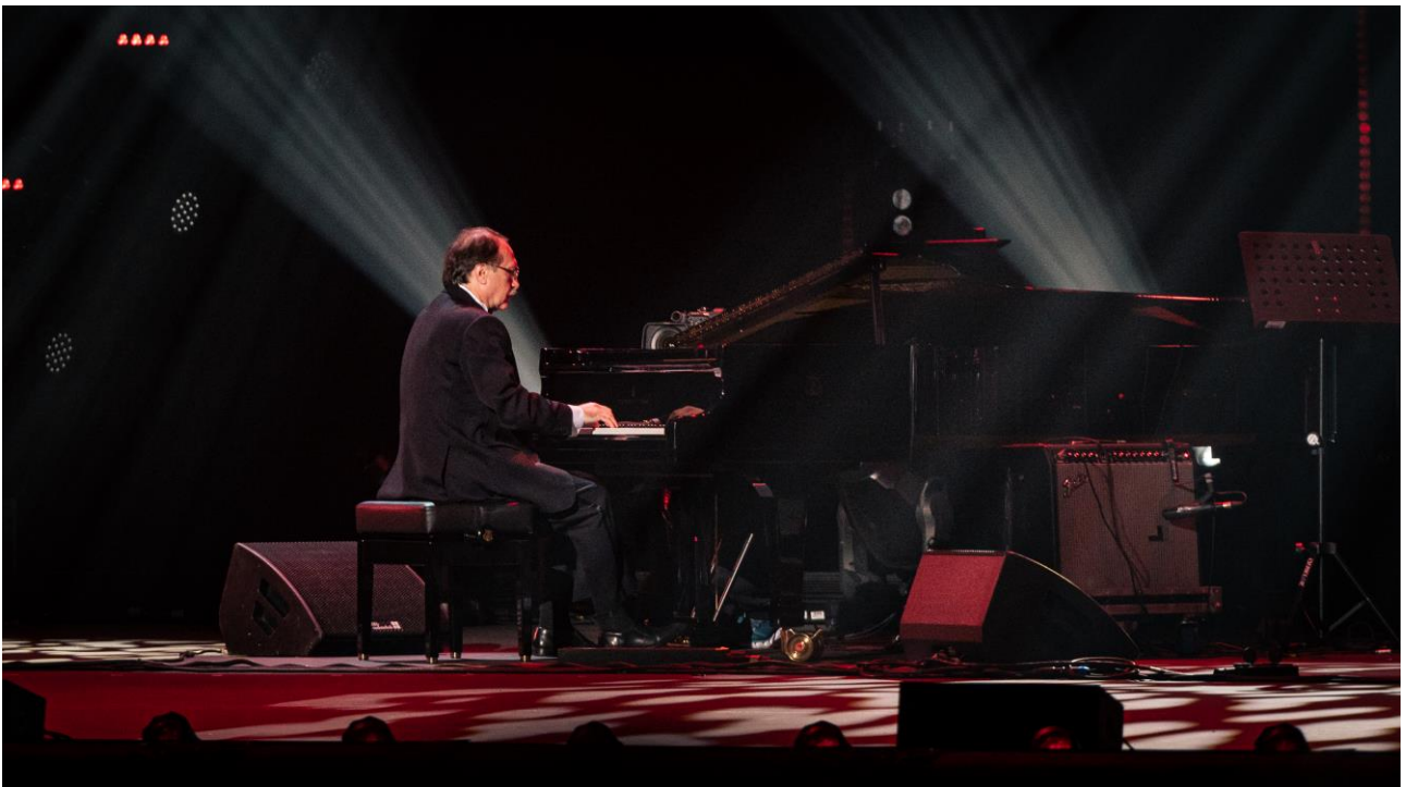
Народный артист РФ Д. Крамер (Гала-концерт к 100-летию российского джаза, Большой театр, 2022 г.)