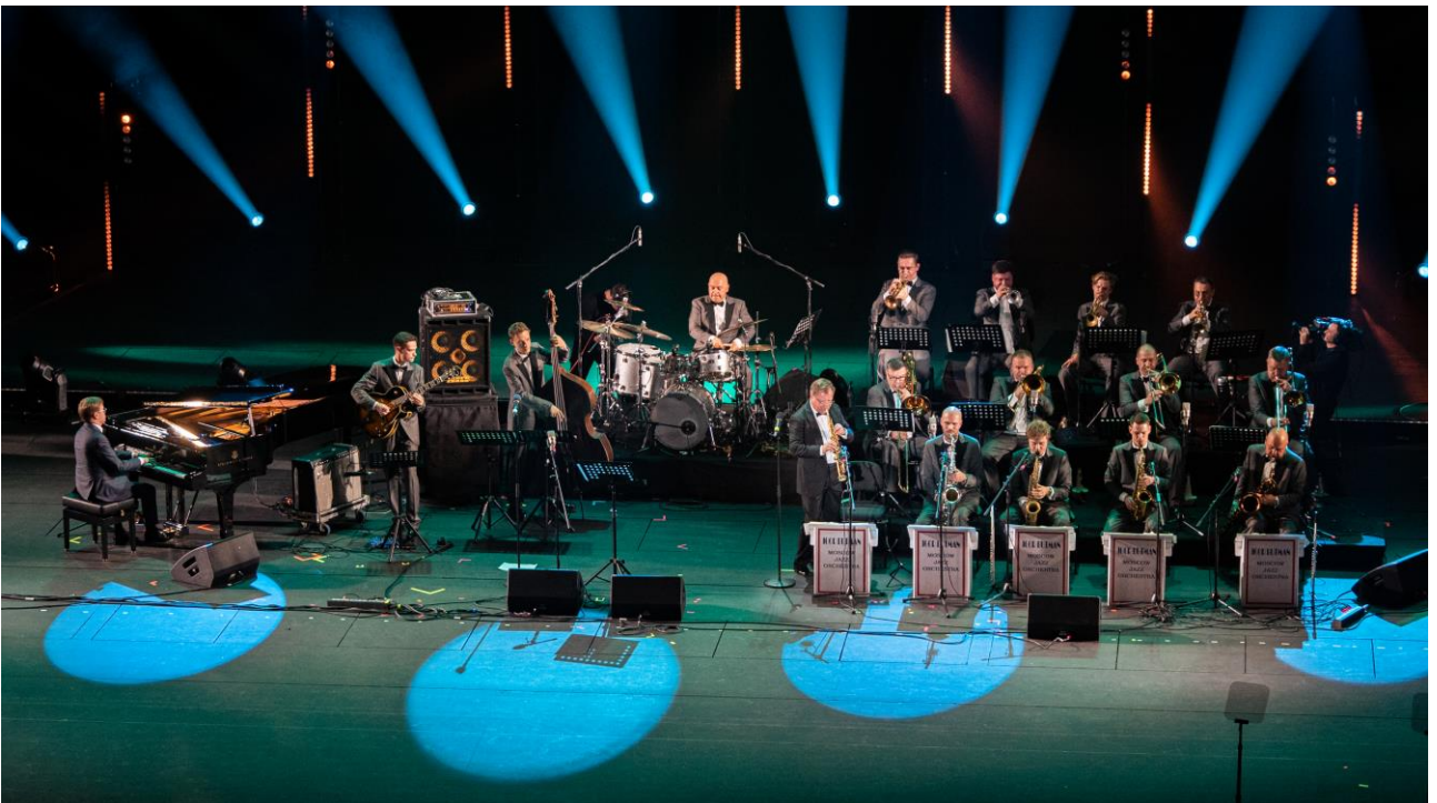
Московский джазовый оркестр п/у И. Бутмана (Гала-концерт к 100-летию российского джаза, Большой театр, 2022 г.)