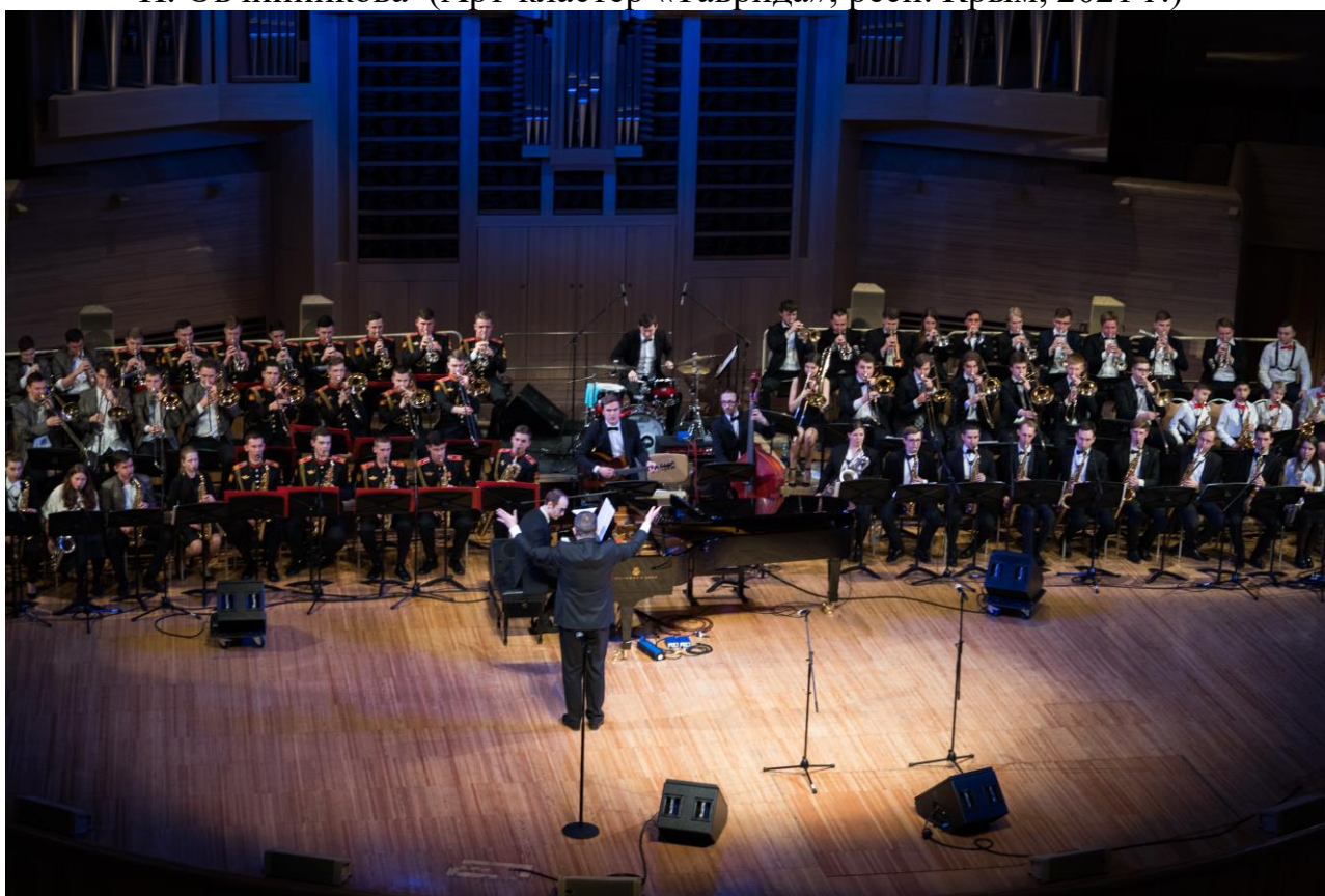
Гала-концерт международного фестиваля-конкурса «Детский триумф джаза» (Светлановский зал ММДМ, Москва, 2020 г.)