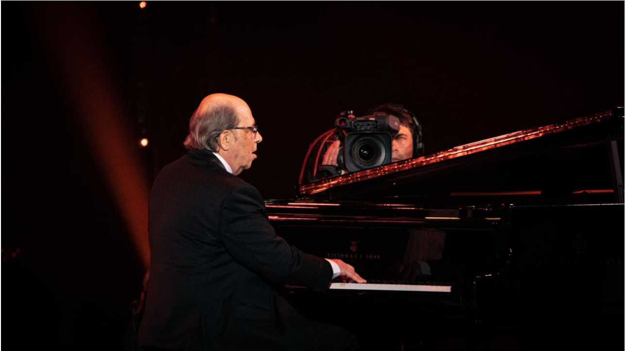
Народный артист РФ И. Бриль (Гала-концерт к 100-летию российского джаза, Большой театр, 2022 г.)