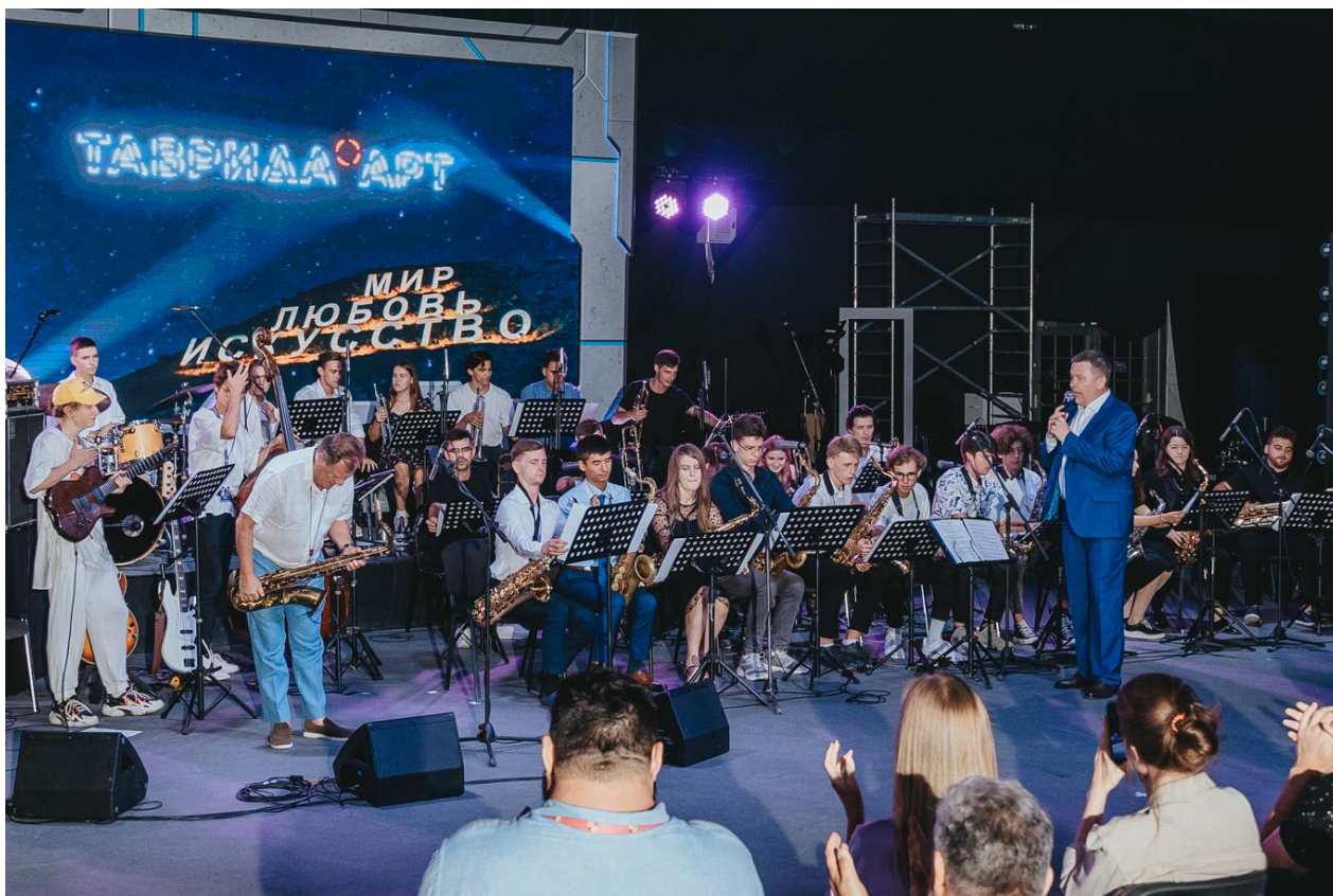
Народный артист РФ И. Бутман и Всероссийский молодежный биг-бэнд п/у П. Овчинникова (Арт-кластер «Таврида», респ. Крым, 2021 г.)