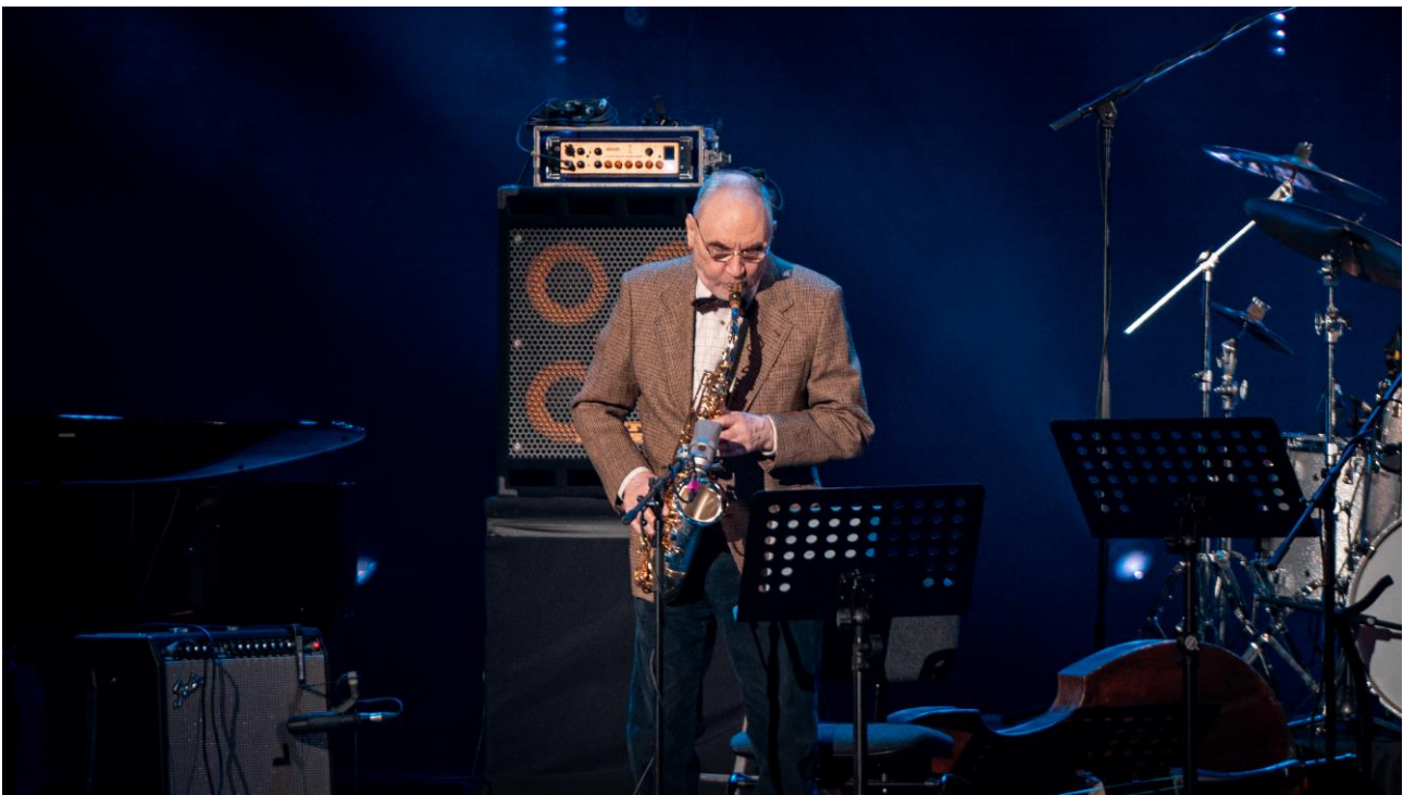
Народный артист РФ А. Козлов (Гала-концерт к 100-летию российского джаза, Большой театр, 2022 г.)