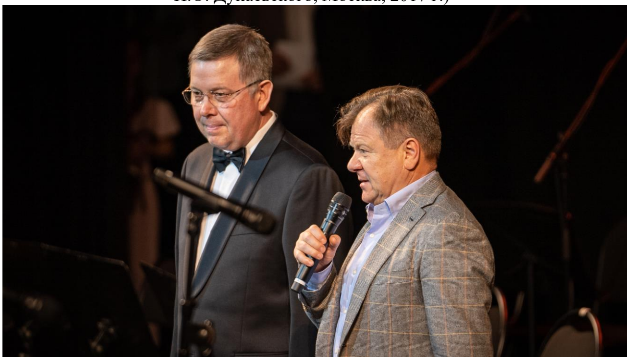
П. Овчинников, Народный артист РФ И. Бутман (Международный фестиваль- конкурс «Детский триумф джаза», Москва, 2021 г.)