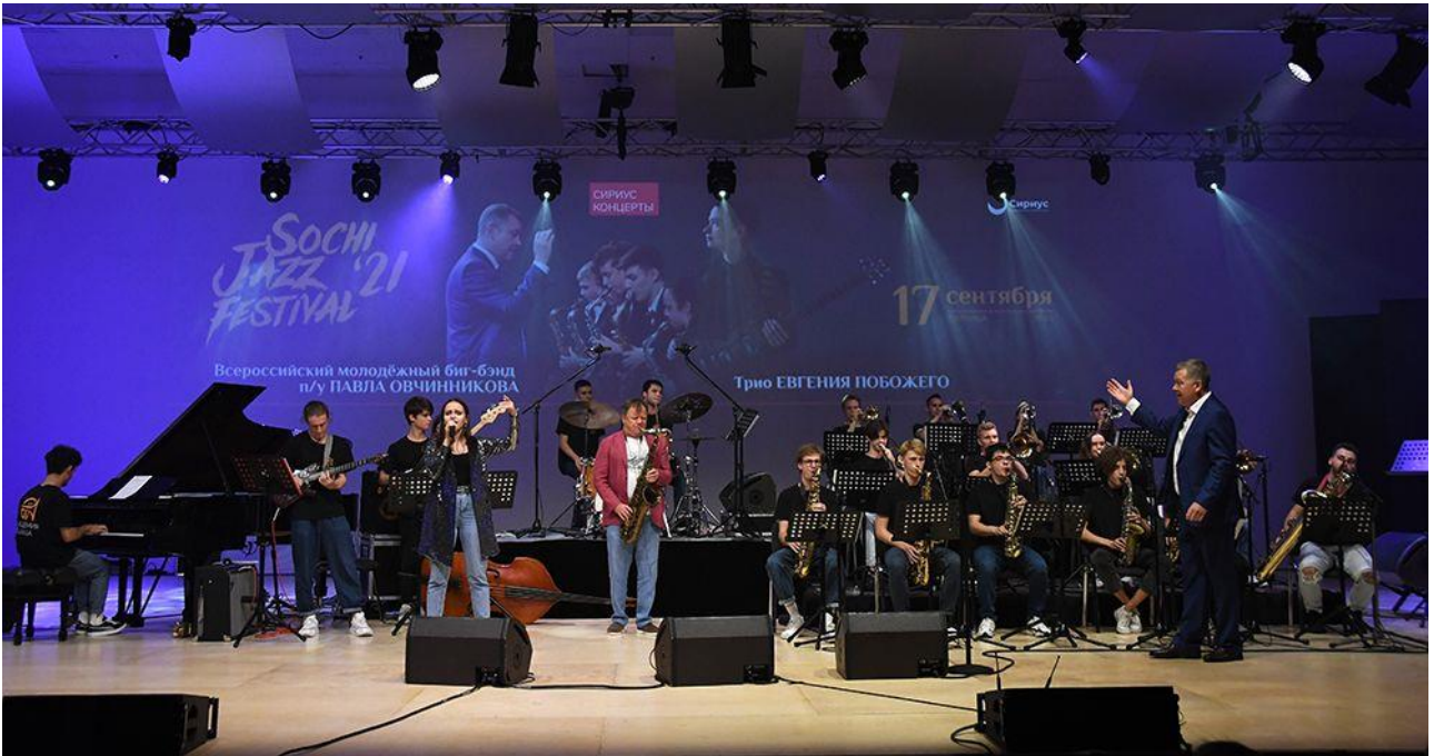
Народный артист РФ И. Бутман и Всероссийский молодежный биг-бэнд п/у П. Овчинникова (Sochi Jazz Festival, ОЦ «Сириус», 2021 г.)