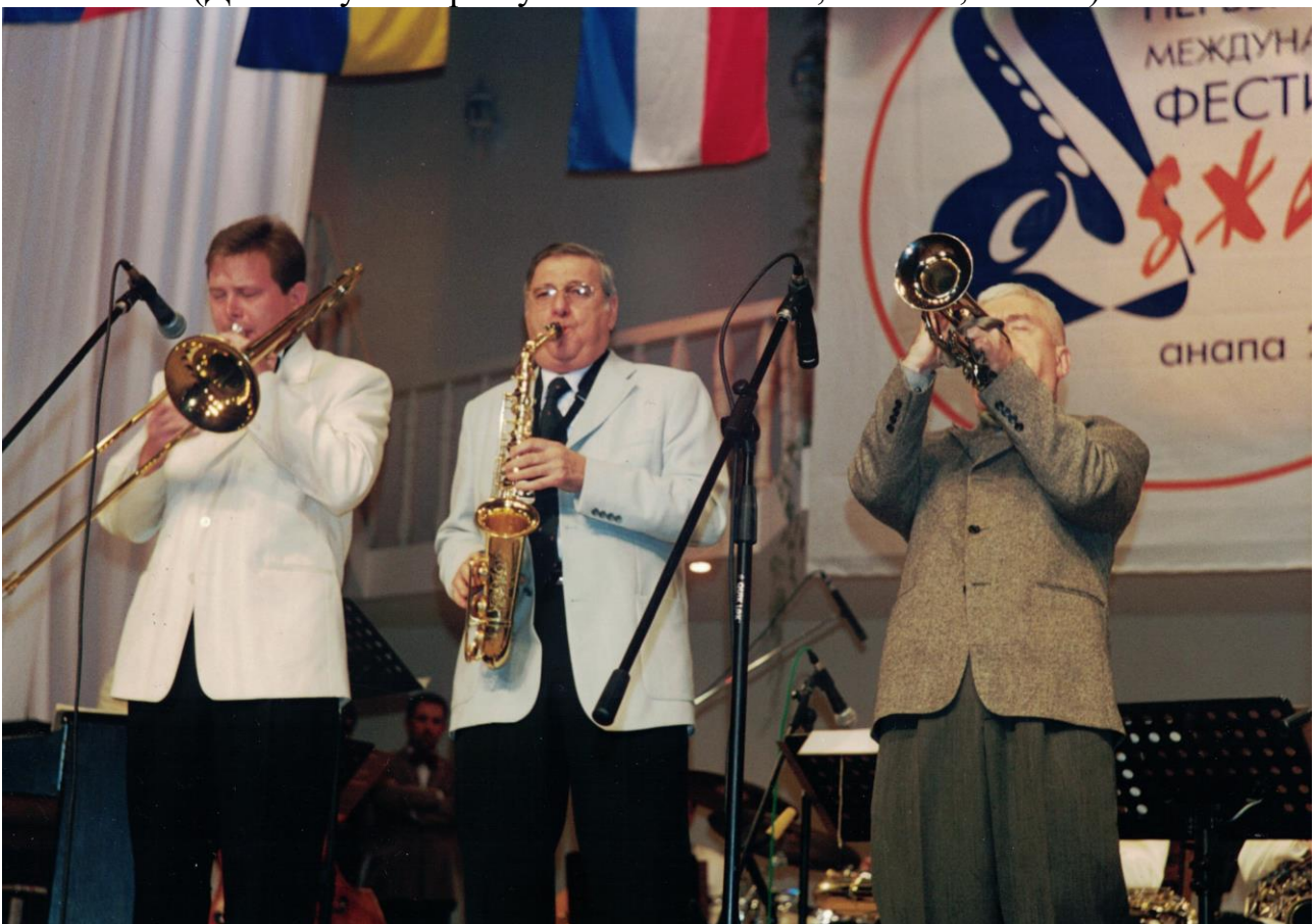
П. Овчинников, Народный артист РФ Г. Гараян, В. Пономарев (Международный джаз-фестиваль в Анапе, 2001 г.)