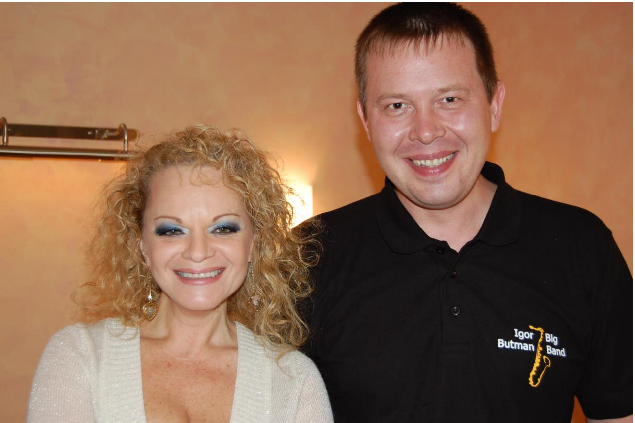
Народный артист РФ Л. Долина, П. Овчинников (во время гастролей по Сибири и Дальнему Востоку с Биг-бэндом И. Бутмана, Омск, 2008 г.)